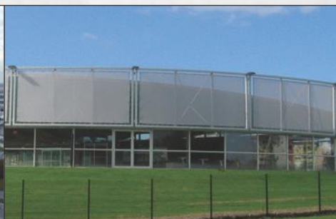
ACOPERIRE CU PÂNZĂ