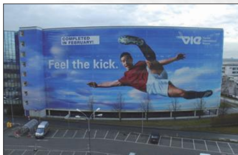
FAȚADĂ PENTRU PANOURI PUBLICITARE