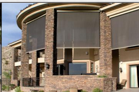
JALUZELE PENTRU FAȚADE