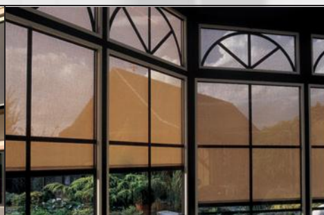
JALUZELE PENTRU PROTECȚIE TERMICĂ