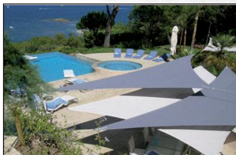
JALUZELE PENTRU UBRIRE